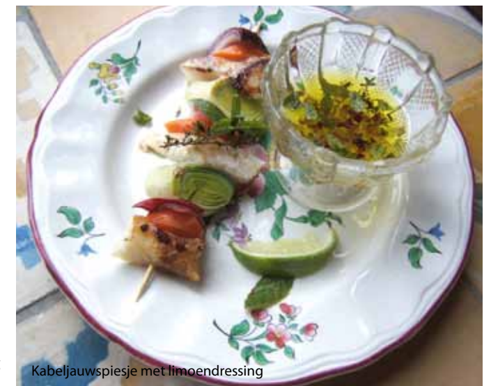
Kabeljauwspiesje met limoendressing