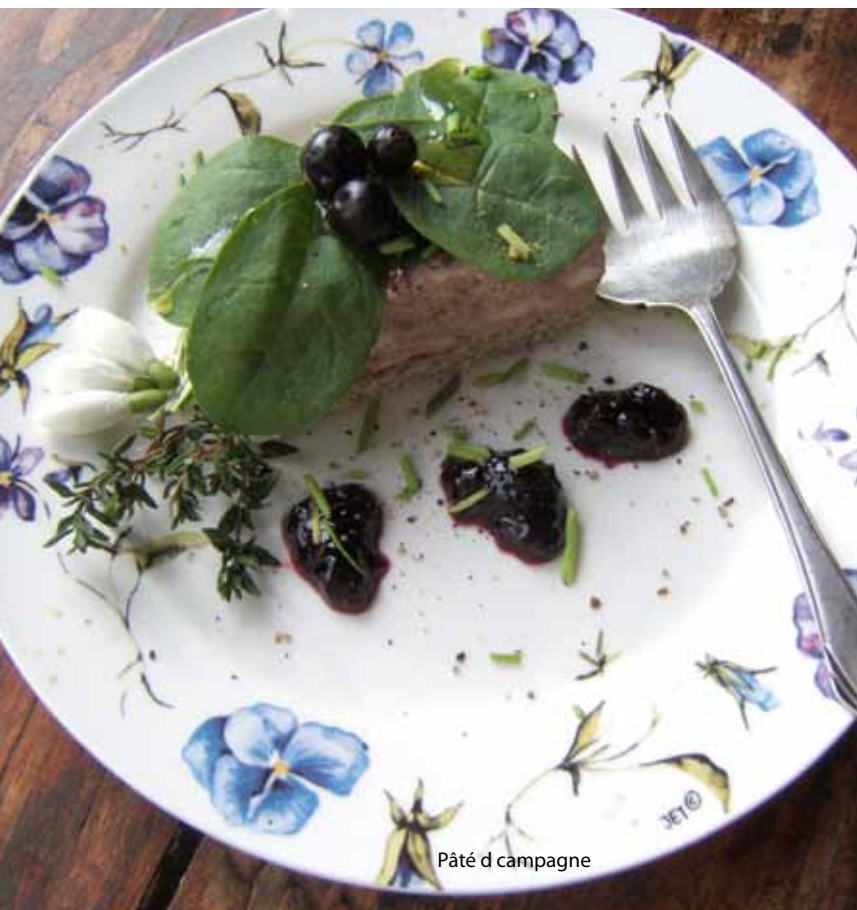
Pâté d campagne