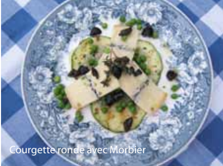
Courgette ronde avec Morbier